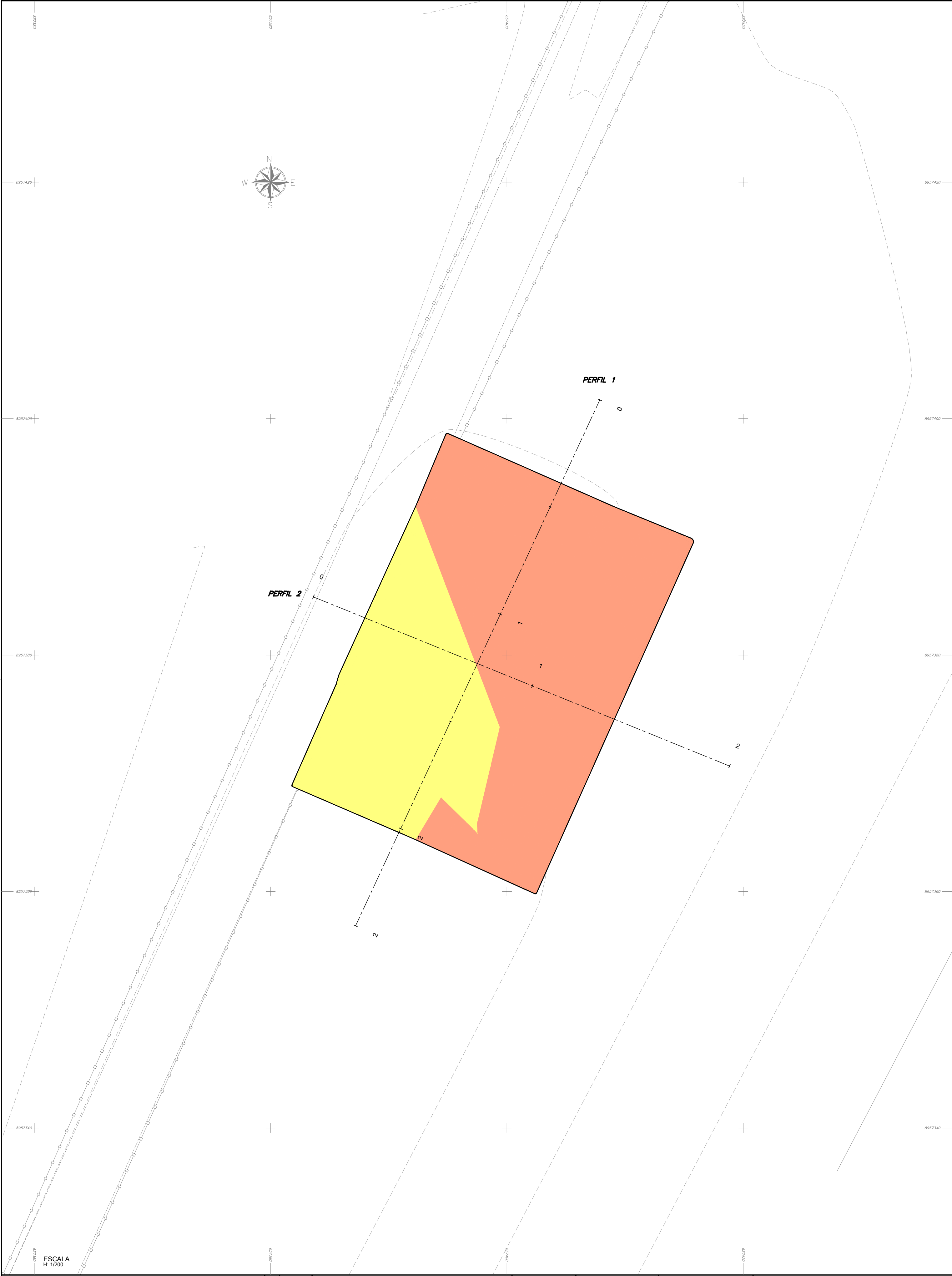
PERFIL PERFIL 1